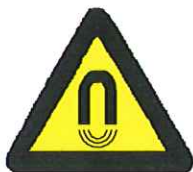
Belangrijk magnetisch veld