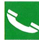
Telefoon voor redding en eerste hulp