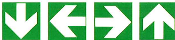
Te volgen richting (wordt tezamen met één van de onderstaande borden gebruikt)