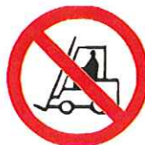
Verboden voor transportvoertuigen