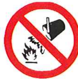
Verboden met water te blussen