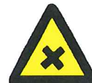
Schadelijke of irriterende stoffen 1