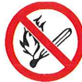
Vuur, open vlam en roken verboden