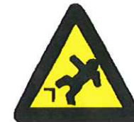
Vallen door hoogteverschil