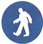
Verplichte oversteekplaats (voetgangers)