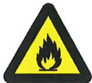
Ontvlambare stoffen of hoge temperatuur