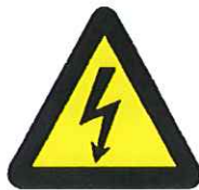
Gevaar voor elektrische spanning