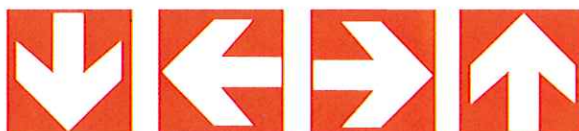
Te volgen richting (wordt tezamen met één van de bovenstaande borden gebruikt)