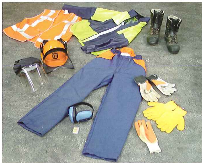
Meer beschermingsmiddelen, minder kans op letsel.

Om onder wisselende omstandigheden goed beschermd te zijn tegen weersomstandigheden, is het van belang dat er een goed kledingpakket is waardoor je de kleding goed kunt afstemmen op de wisselende situatie. Denk daarbij aan de inzet van extra (isolerend) ondergoed, bodywarmers, in- en uitritsbare binnenvoering enzovoort.