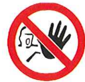
Geen toegang voor onbevoegden