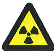
Radioactieve stoffen of ioniserende straling