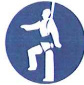
Individueel harnas verplicht