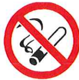
Verboden te roken