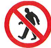
Verboden voor voetgangers